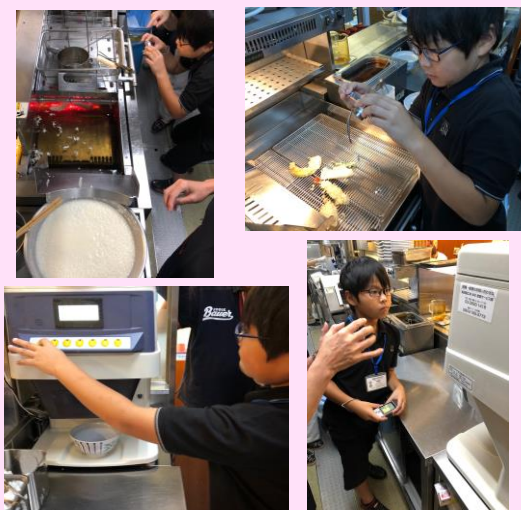
キッチン見学と撮影