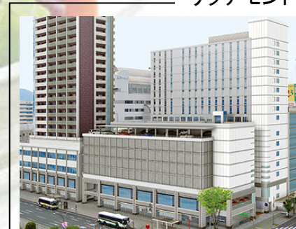
リッチモンドホテル福山駅前