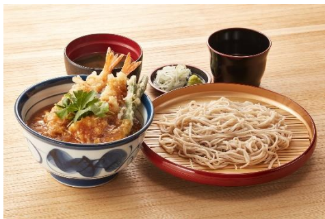
『あんかけ海老天丼サービスセット』 1,000 円

サクッとした歯触りの海老 2 本に鮮やかなとろっと玉子をふんわりとかけた天丼です。かつお節とこんぶの合わせだしの旨みを感じてください。