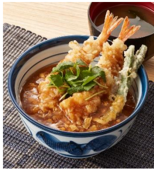
『あんかけ海老天丼』 790 円