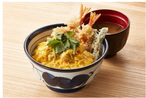
『とろっと玉子の海老天丼』 790 円

サクッとした歯触りの海老 2 本に、てんやオリジナル「特製和風あん」で楽しんでいただく天丼。やさしいかつお節だしの香りが特長です。