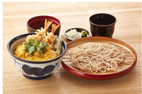
『とろっと玉子の海老天丼サービスセット』 1,000 円

小そば（または小うどん）が通常価格より 40 円お得にお召し上がりいただける、あんかけ海老天丼とのセットメニューです。