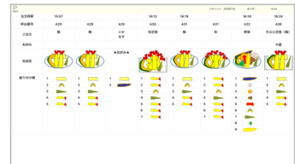
キッチンディスプレイ (イメージ)

厨房の3箇所（揚げ場、盛り場、セッティングカウンター）へキッチンディスプレイを設置。従来はオーダーを店員がハンディターミナル（注文端末）で入力し、キッチンは伝票を確認して調理、味噌汁や麺のセッティングは料理が出来あがるタイミングで厨房からの声掛けにあわせて行っていました。今回開発したキッチンサポートシステムにより、ディスプレイには商品名ではなく調理指示を表示し、商品ごとに必要な天ぷら食材の組合せや数、盛り付け方法をイラストで表示するなど、シニアや外国人の方など多様な人材が働きやすいユニバーサルな環境づくりを推進します。人材の短期戦力化を実現するとともに、天ぷらの品質向上につなげてまいります。