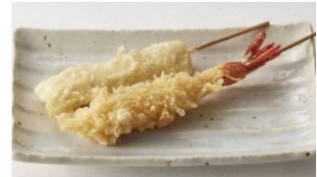
テイクアウト専用のえび・いか串天

生産年齢人口の減少、訪日外国人の増加などスピードを増す市場変化への対応を迫られる中、ロイヤルホールディングスでは持続的な成長を実現するため、グループ全体の業務効率化とIT、ロボティクスの導入など継続したイノベーションをすすめ、従業員満足度と顧客満足度向上につなげることを目指しています。これまで、2017年11月にオープンした完全キャッシュレスやキッチンオペレーションの改革を研究・開発する店舗「GATHERING TABLE PANTRY 馬喰町店」の運営や食器洗浄工程ロボットの実証実験など、次世代の店舗づくりを目指す取り組みを進めてきました。