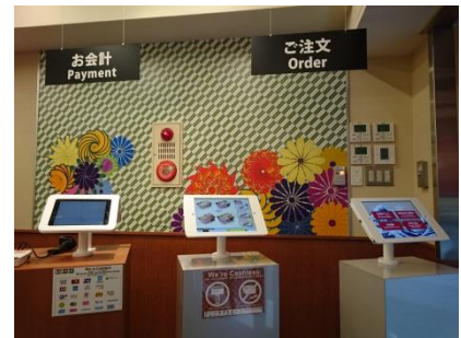
注文・会計・POS 端末

4ヶ国語（英語、中国語、韓国語、日本語）に対応する多言語タブレットで注文を受け、支払いの完全キャッシュレス*化によって、オーダー管理とレジ締め精算が不要になり管理業務が軽減されます。独自に開発したモバイルPOS（mPOS）により、幅広い決済手段に対応し、注文、会計、調理、提供までを一元的にサポートして生産性向上を目指します。管理業務の削減で生じる時間は、お客様との会話や従業員への「おもてなし」教育、商品の品質向上などにあて、お客様により喜んでいただけるような店舗づくりを目指します。