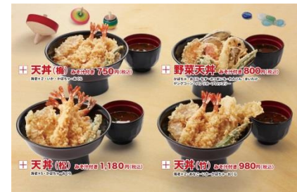
天井（松・竹・梅）と野菜天井

「大江戸てんや」の元店舗となる「天井てんや 浅草雷門店」では訪日外国人客が約9割を占め、現金以外の決済を要望される方が多くいらしたため、「大江戸てんや」では支払いをクレジット、電子マネー、中国モバイル決済の完全キャッシュレス化*としました。メニューは松・竹・梅の天井と野菜天井、江戸時代には一般的だった串天スタイルの天ぷら（テイクアウト専用）など、海外のお客様にわかりやすく選びやすいメニューをご用意しました。また Free Wi-Fi 「FON」を導入し、快適な無線 LAN 環境を提供します。