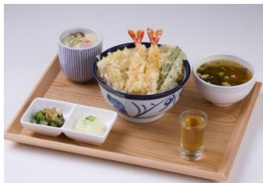
てんや天丼膳 250 元