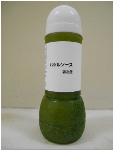
対象商品「バジルソース」