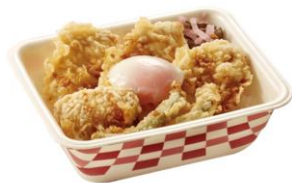
▲華味鳥天井弁当(半熟玉子付き) 740円