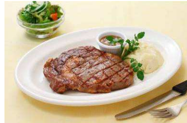
『リブロースステーキ 280g』