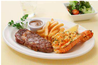
『ステーキ&ロブスター』