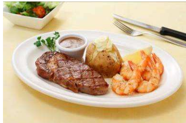
『ステーキ&シュリンプグリル』

ガーリック・バジル・オリーブオイルでマリネしたグリルロブスターとのコンビネーション。