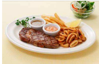
『ステーキ&カラマリフライ』