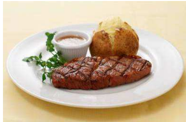
『リブロースステーキ 140g』

人気のステーキメニュー5品(サラダバー付き)が、通常価格の600円引きでお楽しみいただける「ステーキナイト」。濃厚な旨みのあるリブロースステーキとシズラーサラダバーは、シズラーおすすめのベストコンビです。