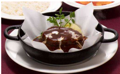
『鉄鍋タンシチュー&ハンバーグステーキ』 【単品】 1,480 円(税込 1,554 円) 962kcal 【セット】 1,780 円(税込 1,869 円)

寒い冬のおすすめとして、ステーキやハンバーグ、グリル、煮込み料理といったロイヤルホスト自慢の洋食メニューをご提供いたします。サラダ、ライス(又はパン)のセットがおすすめです。