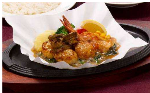
『帆立と海老のあつあつグリル 温野菜添え』 【単品】 1,380 円(税込 1,449 円) 400kcal 【セット】 1,680 円(税込 1,764 円)

ビーフシチューと並び洋食屋の定番で知られるタンシチューをハンバーグにのせて鉄鍋で提供。柔らかく煮込んだ濃厚な味わいのタンシチューとハンバーグのコラボレーションをお楽しみください。