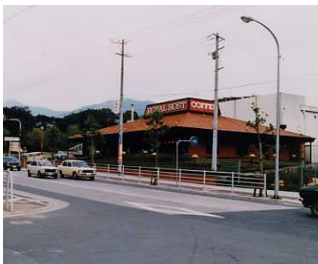
オープン当時の黒崎店 (現青山店・福岡県北九州市)