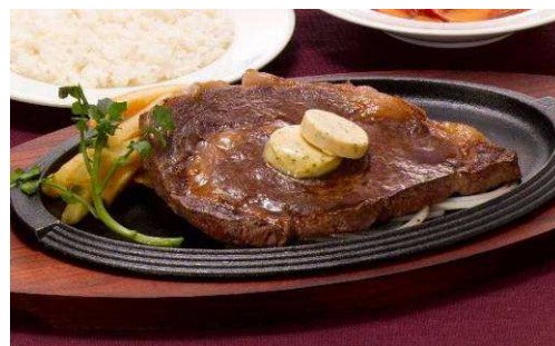
『240g国産牛リブロースステーキ』 【単品】 1,980 円(税込 2,079 円) 1293kcal 【セット】 2,280 円(税込 2,394 円)

人気の黒×黒ハンバーグと、濃厚な海老の香りがつまったソースで仕上げた、北海道産帆立と海老のグラタンのコンビネーションです。