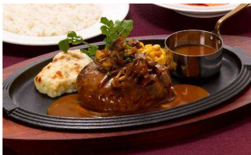
『210g国産 黒×黒ハンバーグステーキ ～ブラウンバターソース～』 【単品】 1,080 円(税込 1,134 円) 814kcal 【セット】 1,380 円(税込 1,449 円)

やわらかく旨みのあるリブロースステーキ 240g を、パセリガーリックバターとだし醤油でお召し上がりください。ステーキがお好きな方におすすめです。