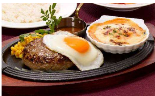
『170g 国産 黒×黒ハンバーグステーキ &帆立と海老のコキールグラタン』 【単品】 1,380 円(税込 1,449 円) 873kcal 【セット】 1,680 円(税込 1,764 円)

旨みの強い帆立と海老をバターでグリルし、醤油ベースのご飯によくあうソースで仕上げました。レモンを搾るとさっぱりいただけます。紙鍋でクツクツと最後まで温かくお召し上がりください。