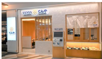
羽田空港第一ターミナル店外観

【神奈川県】平塚田村店、シアルプラット東神奈川店、ポーノ相模大野店、新横浜店、小田原店 【埼玉県】川口店