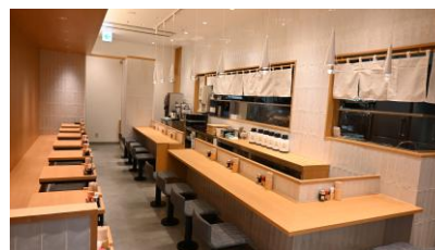
羽田空港第一ターミナル店内観