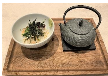
お茶漬け (21:00~22:30 提供)