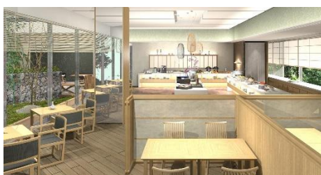
1F レストラン (イメージ)