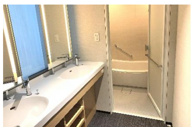
浴室・トイレ・洗面台が独立