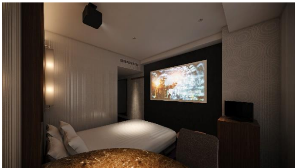
Box Theater Room

「ゲーム」を楽しめる客室は、人気のPCゲームを存分に楽しめるスペックの機材をご用意。ゲーミングモニター、チェア、ヘッドフォン、さらにはライティングにもこだわり、臨場感のある演出の中、人目を気にせずゲーム体験に集中できてテンションが上がる、大人のためのゲーミングルームです。