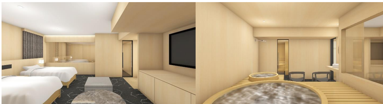
「Spa プレミアツインベッドルーム」

かつての隅田川沿いには宿場が軒を連ねており、旅人たちの宿や休憩処となっていました。そこで、リッチモンドホテル全体を現代の宿場として捉えて、6階にはサウナルームを完備し、「癒」の休憩処を提供します。フロアコンセプトは“湯屋”で、4つの部屋タイプを用意しています。