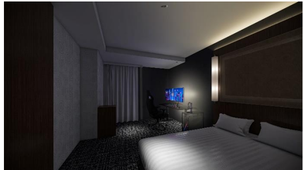
Trial Gaming Room