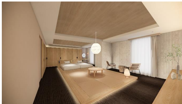
Modern Japanese-style Room

「JAPAN」をコンセプトにした客室は1タイプをご用意しています。茶室のエッセンスを取り入れた和室と洋室の快適性を兼ね備えた和モダンなインテリアで、日本文化と伝統をより身近に感じられるホテルステイを提供します。