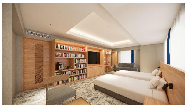
The Premium Book Room