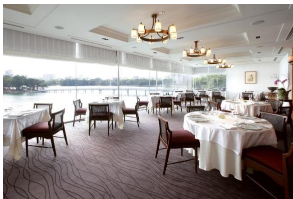
店舗内観イメージ (大濠公園の開放感ある眺望をお楽しみいただけます)