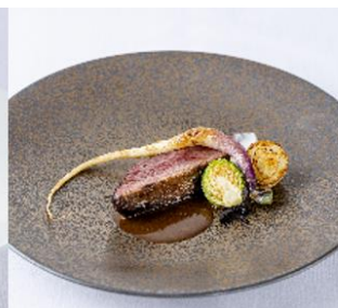
肉料理 福岡県糸島産青首鴨のロースト セリラブのビュレサルミソース