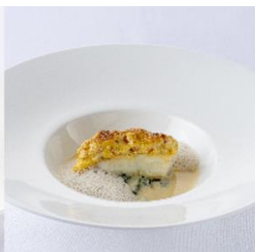
魚料理 九州産平目と雲丹のグラティネ 白ワインソースとキノコの泡