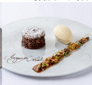
デセール フォンダンショコラ