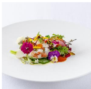
前菜 1 長崎県産イセエビと帆立の アンサンブル 冬野菜とハーブブーケ