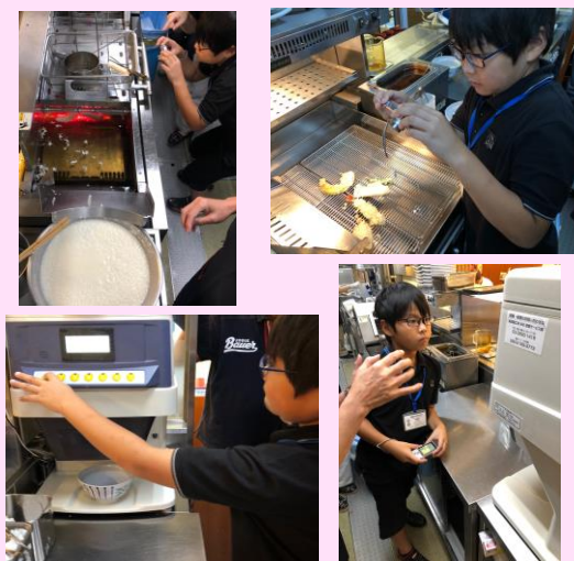
キッチン見学と撮影